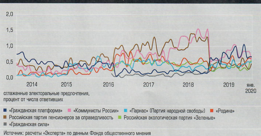
Динамика малых партий. «Зеленые» не «выстрелили» График 4