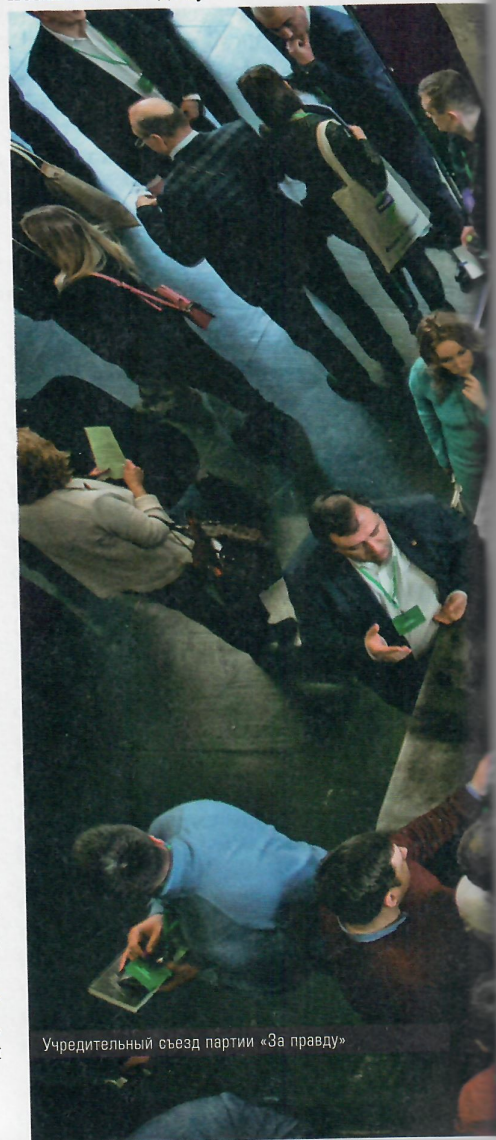
Учредительный съезд партии «За правду»

Так, в первом созыве Госдумы пятипроцентный барьер преодолели восемь партий, еще пять провели одномандатников, плюс были представлены 130 независимых депутатов. Второй созыв