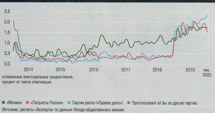
Динамика средних партий. Неожиданный рывок Партии роста и «Патриотов России» График 3

смотря на то, что впереди еще полтора года, а во-вторых, видно, что те партии, на которые вроде бы логично было делать ставку, себя не оправдали. «Коммунисты России» и Партия пенсионеров вроде бы должны были выиграть от состоявшейся пенсионной реформы, но не смогли, а «Зеленые» должны были выиграть от несостоявшейся мусорной реформы, но и здесь не вышло.